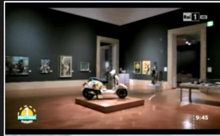
Rai 1 – Uno Mattina