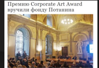
Premio Corporate Art Award vручили фонду Потанина