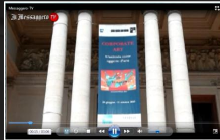
Il Messaggero TV