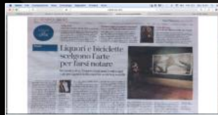
Corriere della Sera