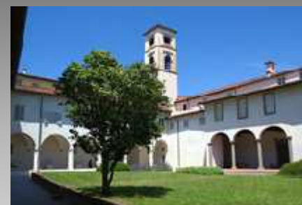
Scuola IMT Alti Studi Lucca