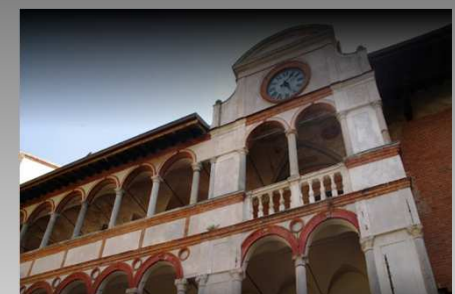
Scuola IUSS Pavia