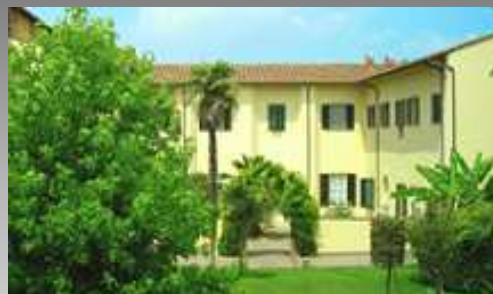
Scuola Superiore Sant'Anna