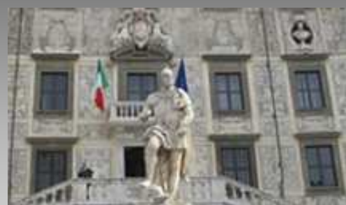
Scuola Normale Superiore